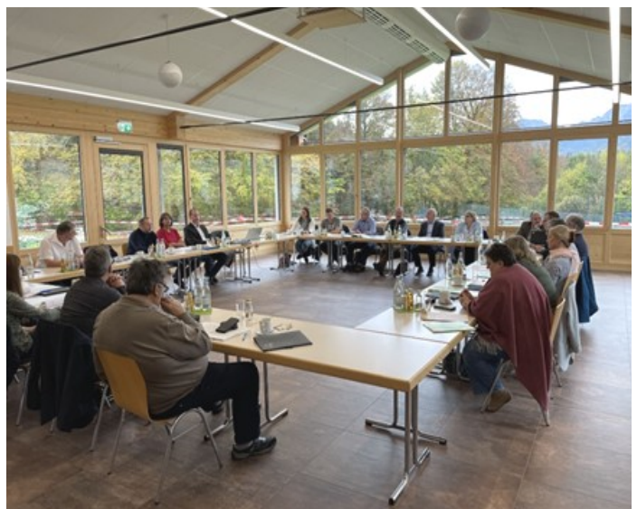
Der Bezirkshauptvorstand bei seiner Sitzung am 24.10.2022 vormittags